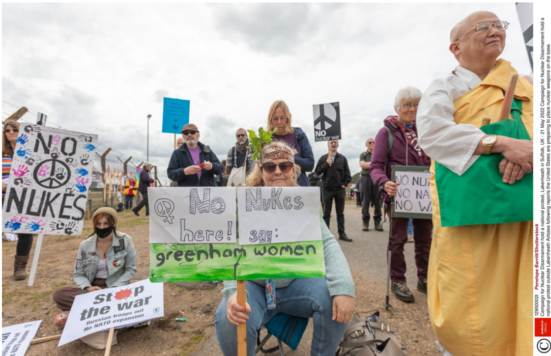
レイクンヒースで行われた反核集会の様相 (2022年)

今回の「謎のドローン」事件は、このようにレイクンヒース空軍基地が注目を集めているさなかに起きた。事件と「アメリカの核の再配備」が関係しているのかどうか、現時点では不明である。しかし、ロシアのウクライナ侵攻以降緊迫する欧州の安全保障環境を象徴する場所の一つとして、この基地をめぐる動向を今後も注視する必要があるだろう。