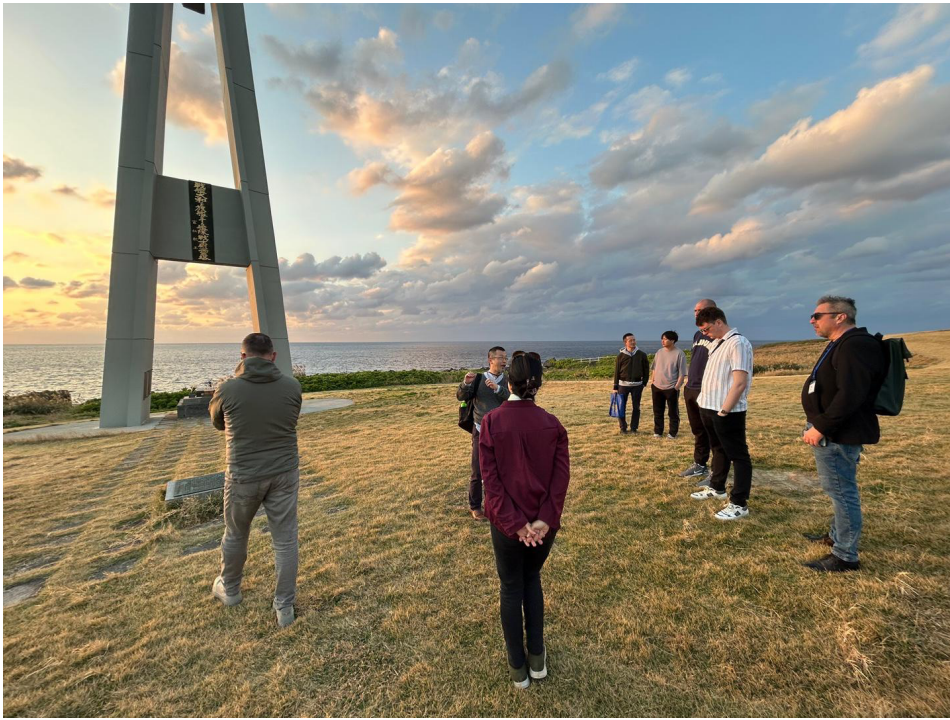
犬田布岬の戦艦大和慰霊碑を見学