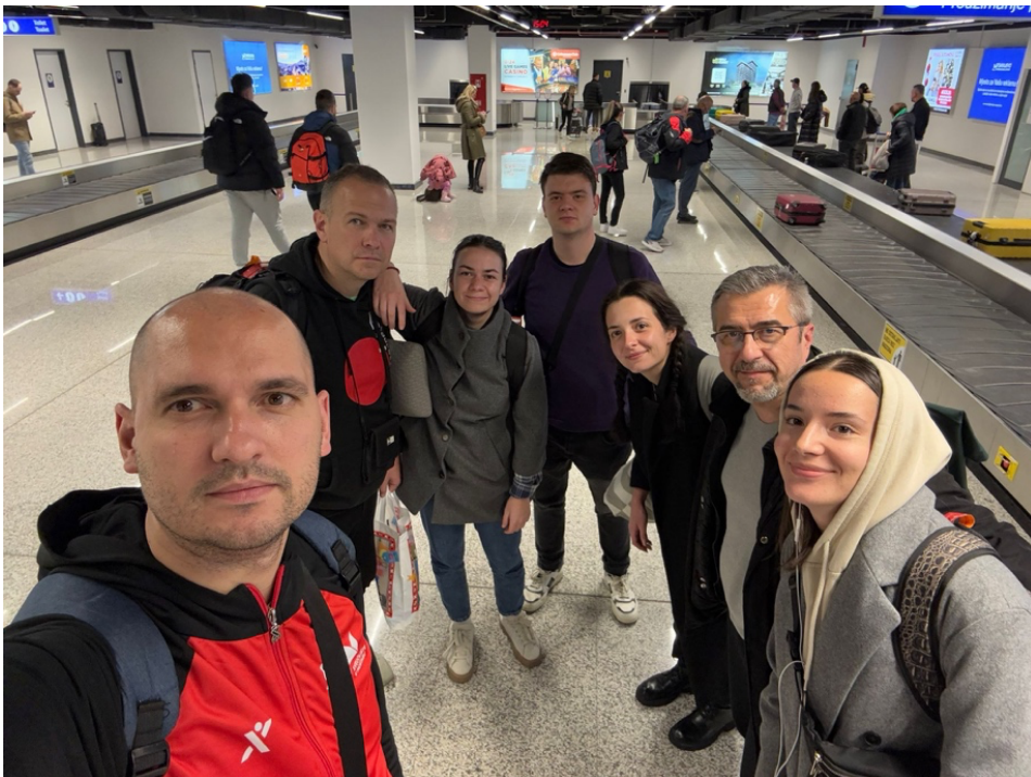
サラエボ空港で最後の記念撮影