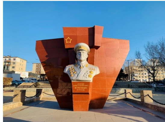
2024 年 11 月 4 日、ウランバートル市内で

今回のモンゴル訪問では、ノモンハン事件 85 周年を記念してプーチン大統領とフレルスフ大統領がジューコフ元帥の記念碑に献花した。その後、両国政府関係者が出席した記念レセプションも開催され、プーチン大統領は「ハルハ河の戦いにおける我々共通の勝利を祝うことができ幸い」「ソ連兵とモンゴル兵に敬意を表するとともに、彼らの功績は 両国民の記憶の中に 、そして 両国の歴史の 1 ページ として残り続ける」とし、両国共通の記憶をアピールした。また、プーチン大統領は「第二次世界大戦下におけるモンゴル国民の〔ソ連に対する〕支援を我々は記憶して」おり、こうした過去の協力に基づき「両国は今も積極的に交流し、包括的な戦略的パートナーシップを発展させ続けている」と指摘した。